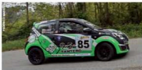
La Twingo molto solitaria della coppia Innocenti-Lenzi, primi di RS1.6.

Classe RS1.6: 1. Innocenti-Lenzi (Renault Twingo) in 1.00'20"2.