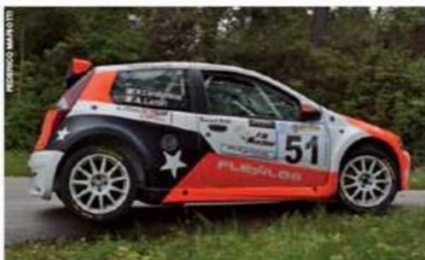
C'è ancora spazio per la Fiat Punto. Ecco Lenzi-Carabellese, primi di K10.