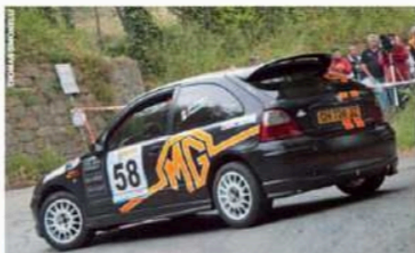
Di Marchetti-Parducci, primi in classe A5, è stato da tempo detto tutto.