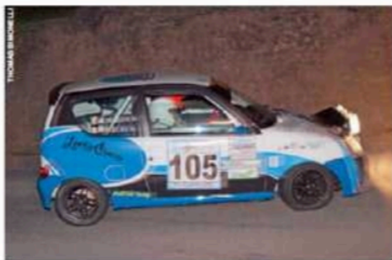
Più di 5 minuti di vantaggio per Bonechi-Moschini, vincitori di classe N0.