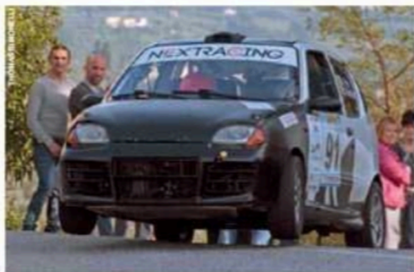
Con poco più di un secondo di vantaggio Friz-Bertini hanno vinto in A0.