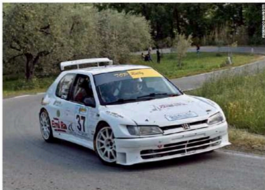
Settima piazza assoluta e successo di K11 per Fagni-Massarò su una Peugeot 306 sempre bella da ascoltare.